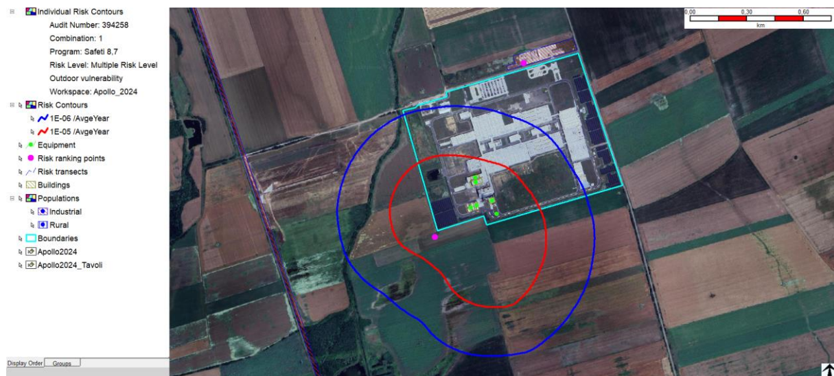
1. ábra A halálozás egyéni kockázati görbéi az Apollo Tyres (Hungary) Kft. telephelye körül (mérgező és tűzhatások együtt).

Az eredmények azt mutatják, hogy a halálozás egyéni kockázata szempontjából elfogadható szintű kockázatot jelent az Apollo Tyres (Hungary) Kft. telephelyének működése.